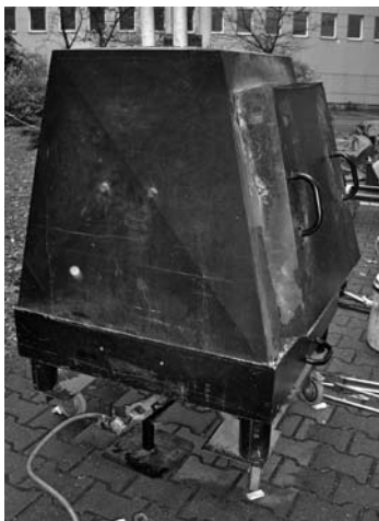
Der Raku-Brandofen im Hof der VHS

Kursort: Hohenzollerndamm 174, R. 0037, Keramikwerkstatt, EG